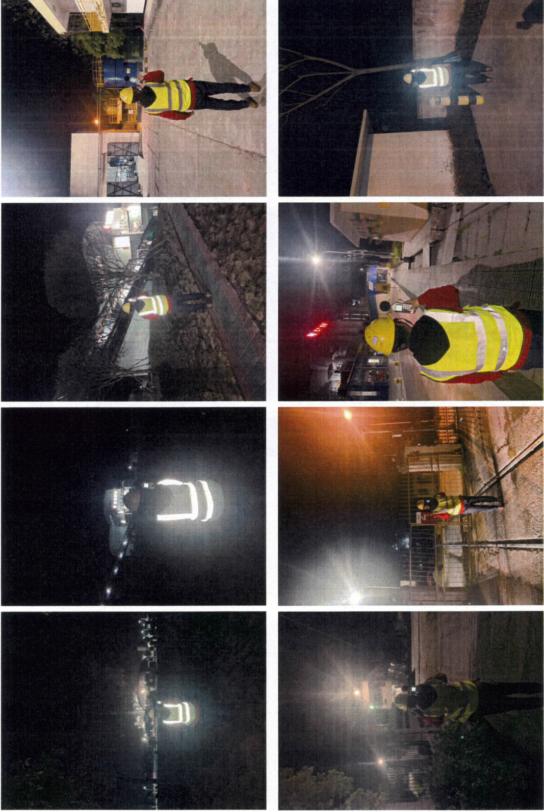
附图 2：部分现场检测测图