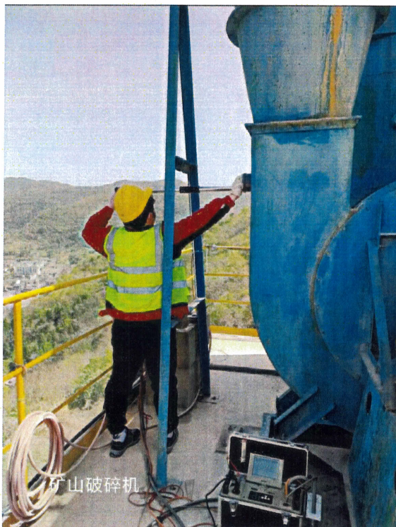
矿山粉碎机排放口 (DA001)